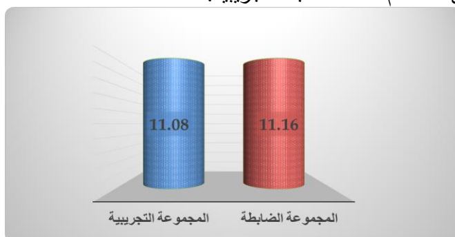
شكل (١) متوسطي درجات المجموعة التجريبية والمجموعة الضابطة في التطبيق القبلي للاختبار التحصيلي لمقرر الدراسات الإسلامية

ومن الجدول السابق يتضح أن قيمة (ت) غير دالة مما يدل على أنه لا توجد فروق ذات دلالة إحصائية بين متوسط درجات طالبات المجموعة التجريبية والمجموعة الضابطة في التطبيق القبلي للاختبار التحصيلي لمقرر الدراسات الإسلامية، أي أن المجموعتين متكافئتين وذلك يعني أن أي فروق تحدث يمكن إرجاعها إلى استخدام مادة المعالجة التجريبية.